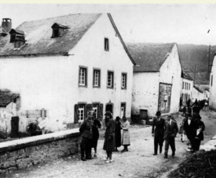
Trierer Str. 36