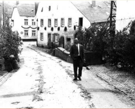
Trierer Str. 35 (hinten links)