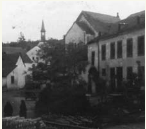
Ehemalige Synagoge heute und vor 1938