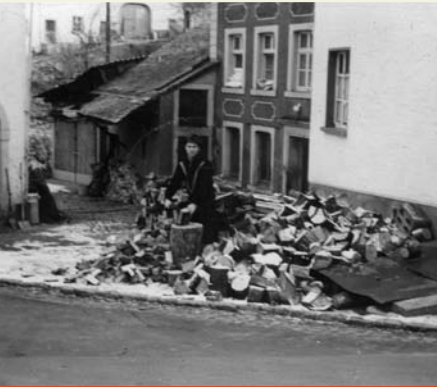
Beßlicher Str. 2

Zeitzeuge (stammt aus diesem Haus): „Wenn in der Karwoche vor Ostern die Dorfbuben katholischer Konfession nach alter Väter Sitte ab Gründonnerstag-nachmittag mit ihren Rappeln das Glockengeläut ersetzten, war auch das jüdische Passahfest nahe. Zum Passah-Mahl wurde bei den Juden ungesäuertes Brot gebacken. Wurde nun am Karsamstag von den Rappeljungen an den Haustüren Eier und Geld als Lohn für ihre Tätigkeit gesammelt, so gab es bei den jüdischen Familien, bei denen ebenfalls gesammelt wurde,