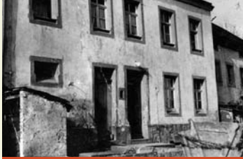
Beßlicher Str. 3