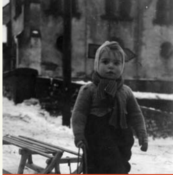
Kind vor der Synagoge