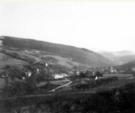
Aach vor 1940

war ebenfalls verwüstet. Mehl, Salz und Zucker, was dort in Säcken gelagert wurde, warfen sie auf die Straße. Anschließend schütteten sie Öl und Petroleum darauf, damit die Waren ungenießbar wurden und sich keiner mehr davon etwas nehmen konnte. Obendrüber in der Wohnung wurden die Federbetten aufgeschlitzt.“