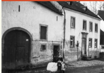
Beßlicher Str. 7