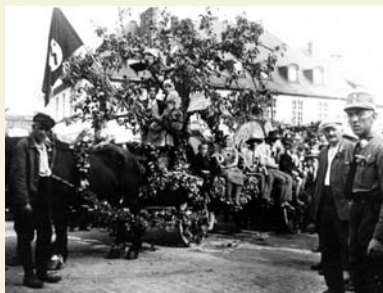
Aacher Erntedankwagen 1933 in Trier