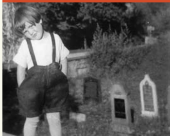
Jüdischer Friedhof vor der Zerstörung

Zeitzeuge: „Obwohl es verboten war, nahmen ein halbes Dutzend Frauen aus dem Dorf an der Beerdigung einer der letzten Jüdinnen, die hier begraben wurde, teil. Eine Bewohnerin verriet sie an die örtlichen Nazis. Strengen Verhören folgte eine Verurteilung jeder einzelnen Person zu einer Strafe von 60,- Reichsmark. Dies war eine Summe, die keine der Frauen aufbringen konnten. Später folgte eine Amnestie.“