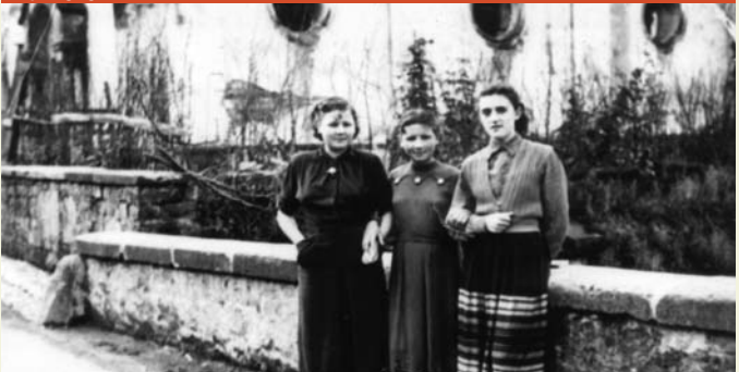
Synagoge noch mit runden Fenstern

Zeitzeuge: „Im Krieg wurde in der Synagoge alles zerstört. Die Fenster zerbrochen, das ganze Mobiliar auf die Straße geworfen. Anschließend wurde die Synagoge zum Gefangenenlager umfunktioniert, in dem serbische und französische Kriegsgefangene, die bei den Bauern gearbeitet haben, unter der Bewachung deutscher Soldaten geschlafen haben. Die Gefangenen wurden morgens zu den Leuten gebracht, bei denen sie tagsüber arbeiten mussten, und abends wurden sie wieder abgeholt und in die Synagoge gesperrt.“